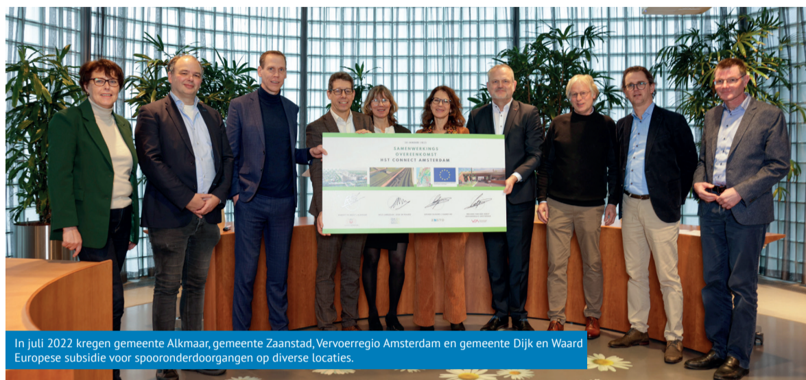
In juli 2022 kregen gemeente Alkmaar, gemeente Zaanstad, Vervoerregio Amsterdam en gemeente Dijk en Waard Europese subsidie voor spooronderdoorgangen op diverse locaties.