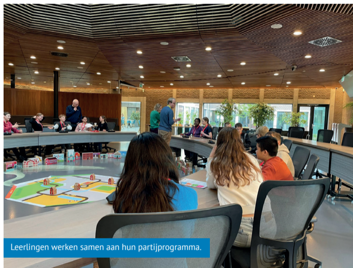
Leerlingen werken samen aan hun partijprogramma.

In groepjes werkten ze aan een kort partijprogramma en bedachten ze wat ze écht belangrijk vinden. Ze gaan voor: buitenspeelplekken voor tieners, dat iedereen een fijn huis heeft, parken met veel groen en voorzieningen, leuke activiteiten en genoeg werk voor iedereen. Daarna koos elke groep gebouwen die daarbij passen. Het budget en de ruimte is beperkt,